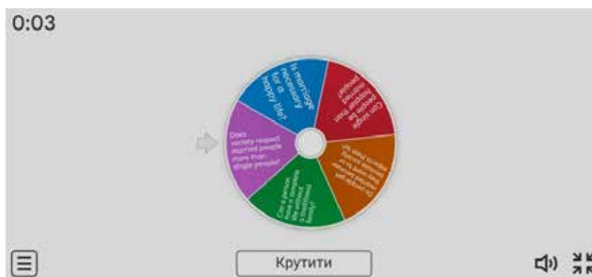
Рис. 2. Використання платформи Wordwall для організації дебатів